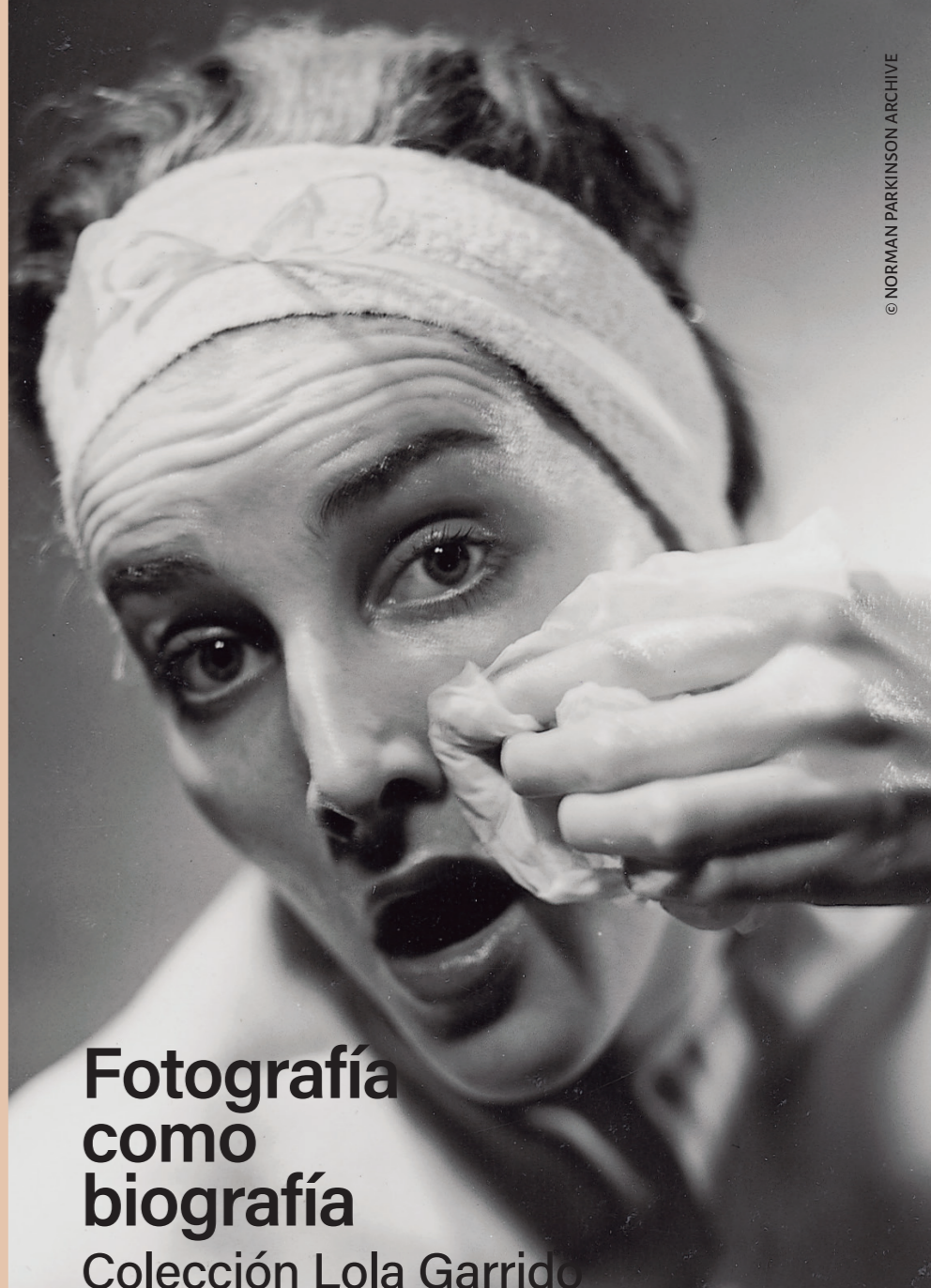
IMAGEN DE PORTADA II: NORMAN PARKINSON. ANUNCIO DE JABÓN PALMOLIVE. 1939